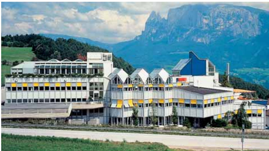
Sede central de empresa con administración y producción de verandas en Ritten (Südtirol)

FINSTRAL ofrece soluciones específicas y orientadas a las exigencias de los mercados y proporciona un servicio orientado al consumidor. Los sistemas de puertas y ventanas FINSTRAL están certificados por el instituto técnico IFT, cumplen la garantía RAL y están acreditados en la práctica por la venta de mas de 15 millones de unidades. La empresa Finstral posee la certificación según DIN EN ISO 9001 y DIN EN ISO 14001.