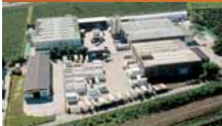
Fabrica Kurtatsch (I) Perfiles y ventanas