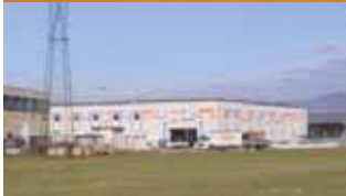
Almacén principal Kurtatsch (I)