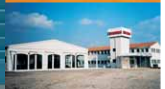
Finstral Vallmoll (E) Almacén y distribución