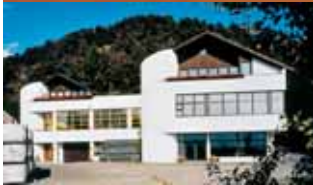
Fabrica Weber im Moos (I) - Perfiles