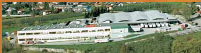
Fabrica Scurelle (I) – Ventanas y vidrio cámara