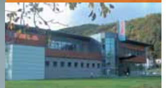
Finstral Wihr au Val (F) – Distribución