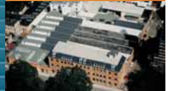
Finstral Greiz (D) Ventanas, verandas