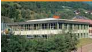
Fabrica Barbian (I) - Mallorquinas