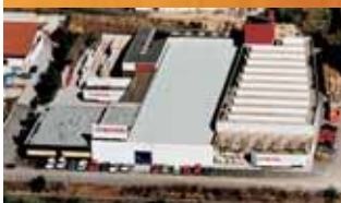
Fabrica Schabs (I) - Ventanas