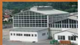
Fabrica Borgo (I) Puertas y ventanas en aluminio