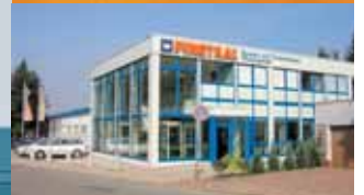
Finstral Nord Bad Lauterberg (D) Ventanas