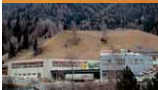
Fabrica Villnöß (I) – Puertas de calle