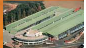
Finstral Gochsheim (D) Ventanas, verandas, vidrio cámara